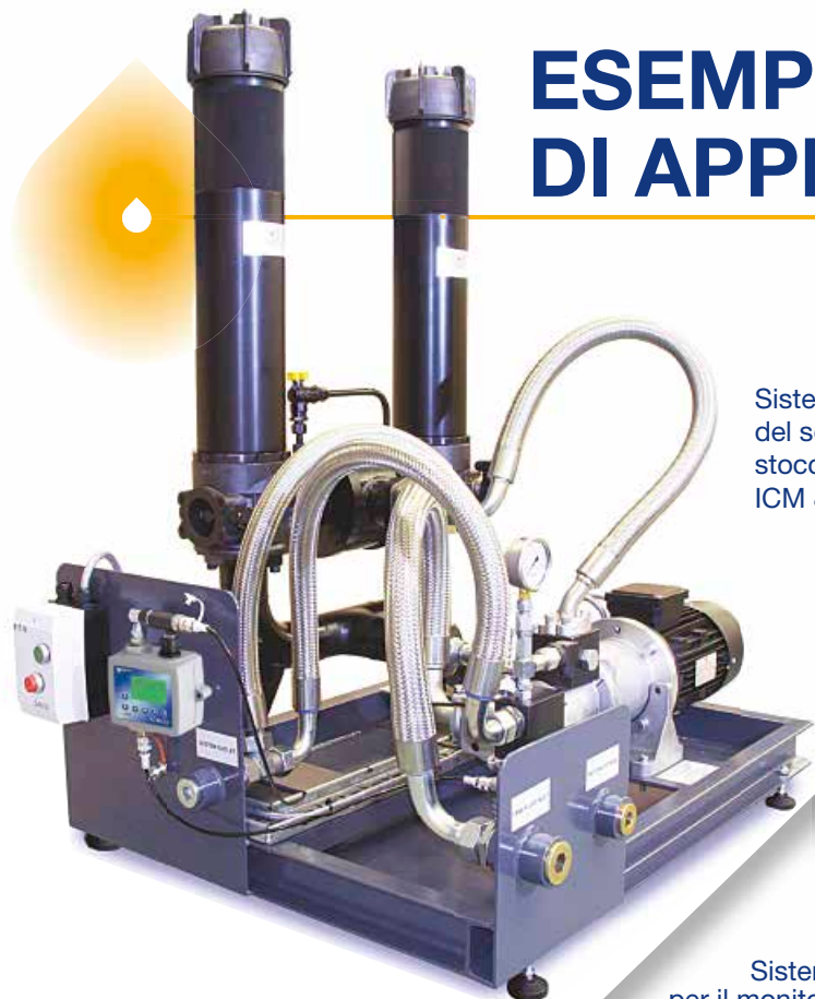
Sistema di filtrazione del serbatoio di stoccaggio con ICM & quadro elettrico