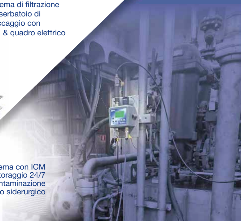
Sistema con ICM per il monitoraggio 24/7 della contaminazione in un impianto siderurgico